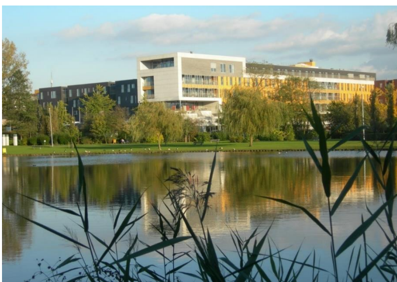
Wzc De Meers

Heb jij interesse? Neem verder een kijkje in onze informatiebundel.