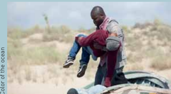
Color of the ocean

Bij beeldend kunstenaar Nicolas Provost spoelt een Afrikaan aan op een naaktstrand in Zuid-Europa. Hij komt in onze eigen hoofdstad terecht en evolueert van slachtoffer tot indringer, ‘The Invader’.